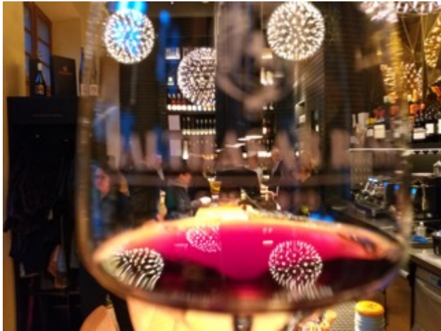
2016 Caviar Rheingau Pinot Noir trocken

In der Nase dicht mit rauchigen und röstigen Tönen, klarer Beeren- und Kirschfrucht sowie Noten von Nüssen, teilweise getrockneten Kräutern und Gewürzen. Im Mund kühl, dicht, geschliffen und saftig mit Aromen von Kirschen und Beeren, Kräuterwürze, Mineralität, feiner Säure, feinem Tannin und sehr gutem Abgang; sehr fein mit wohldosierter Kraft.