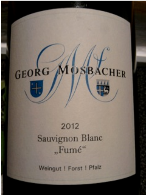
2012 Sauvignon Blanc Fumé, Mosbacher, Pfalz,