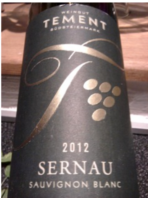
2012 Sauvignon Blanc Sernau, Tement, Steiermark, Österreich