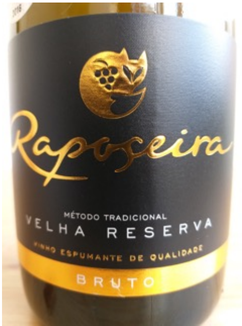
2009 Velha Reserva bruto, Raposeira (Douro, Portugal)

in der Nase: florale Töne sowie Noten von Quitten, dunklen Beeren und Birnen